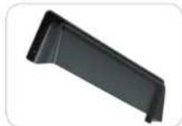
WC/BL Cubierta para intemperie en negro