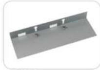
UTB-HR100 Soporte fijado en el techo