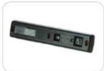
BF-1 Herramienta de instalación Spot-finder