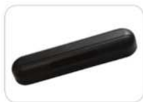
SSR-3-COV/BL Cubierta del sensor en negro SSR-3-COV/S Cubierta del sensor en plateado